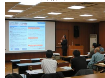
北海道経済産業局