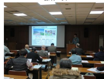
函館地域産業振興財団